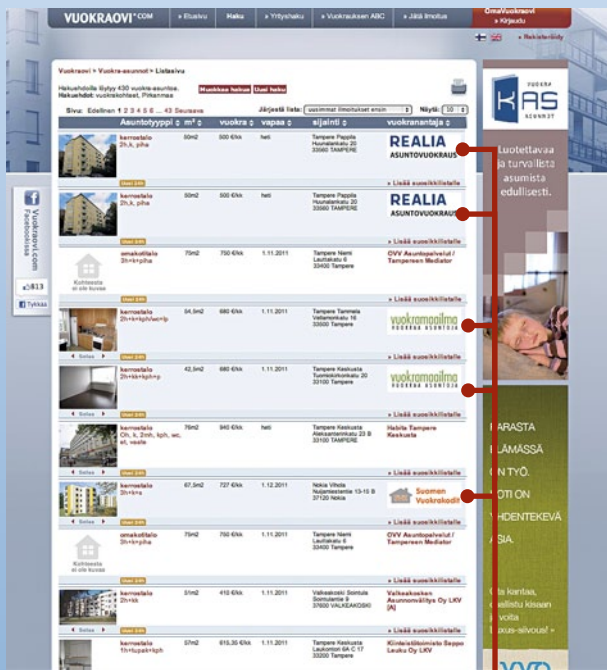
Listasivun kohdekorostus ja logo