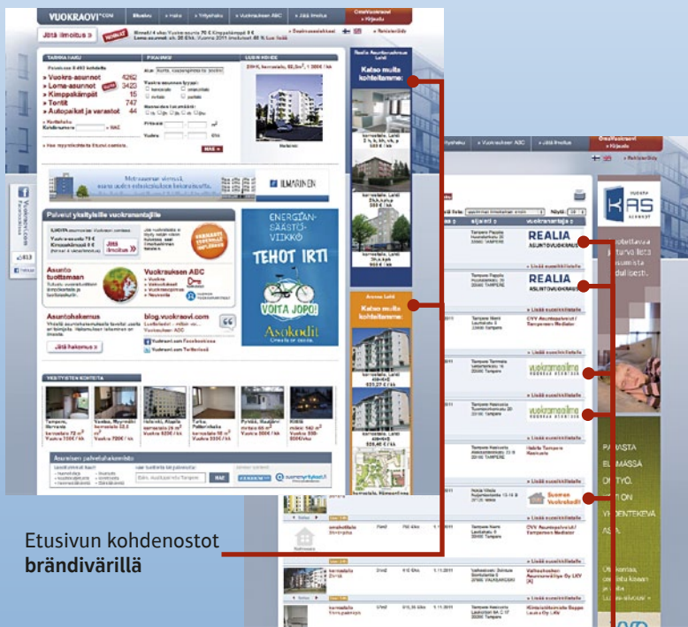
Etusivun kohdenostot brändivärillä